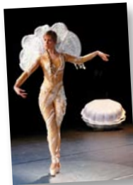
Le « tour du monde »... après plusieurs mois de préparation et d'intenses répétitions !