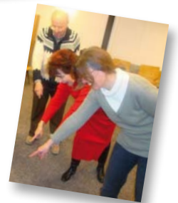
A la découverte du rire et de ses bienfaits avec le Club de rire.