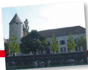
Voici un photomontage du Château vu du lac suite à la plantation des trois ginkgos biloba.