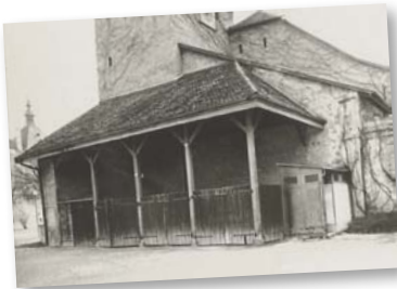
Certaines vespasiennes étaient encore en service à la fin des années 1950.

Dans la séance suivante, il est relevé que : « Monsieur le boursier dépose sur le bureau plusieurs coques d'urinoirs en fonte de diverses dimensions qui lui ont été adressées sur sa demande par la fonderie R. Bieter à Winterthur. Les prix courants qui accompagnent ces croquis et qui varient de Fr. 360.- à Fr. 650.-, non compris la pose, paraissant très élevés à la Municipalité, laquelle sans se prononcer sur l'adoption ou le rejet de l'un ou l'autre des modèles déposés, invite la commission à poursuivre ses études et à s'enquérir du prix de revient d'un urinoir en ciment de petite dimension ».