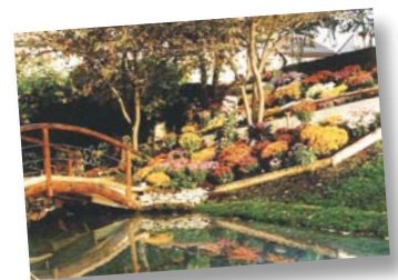
Quelques reflets de l'exposition florale de 1987 qui saluait l'inauguration du Musée suisse du jeu