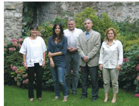
L'équipe administrative et technique du Service vous accueille au 1 er étage de la Maison de commune de 7h30 à 12h et de 13h30 à 16h30.

Le Service assure enfin la gérance du parking des Mousquetaires sis à la rue des Anciens-Fossés et la vente des vins de la commune chaque mardi de 16h30 à 17h30 à la cave du collège Charlemagne. ■