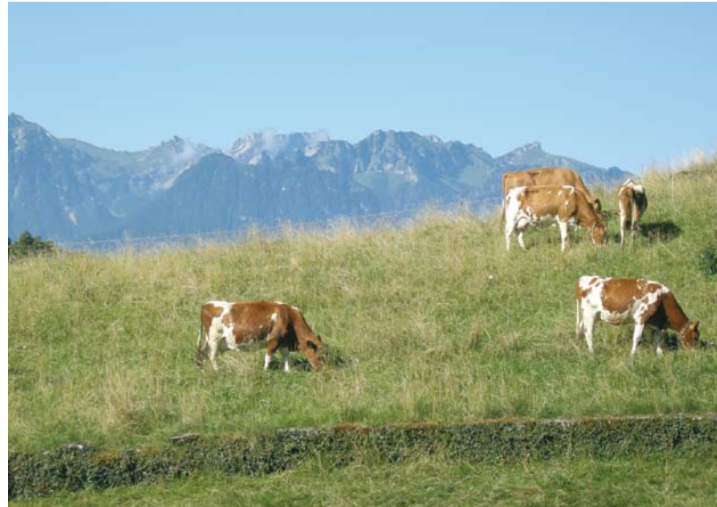
Meuh oui, nous sommes bien à La Tour-de-Peilz, plus précisément au chemin du Crotton !

Ce sont ainsi autant de paysages préservés de l'urbanisation et de bouts de campagne à la ville qui incarnent la richesse et l'équilibre de notre commune et qui ne demandent qu'à dévoiler leurs charmes.