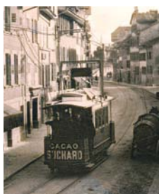
La première ligne de tramway fut inaugurée sur la Riviera le 1 er mai 1888.

« Mais s'il est une chose faite pour étonner les étrangers, c'est le mélange bizarre de simplicité toute primitive, de restes du passé et de civilisation moderne que présente La Tour-de-Peilz : dans la Grand'rue, où vous vous tordez les pieds sur d'affreux petits pavés, vous venez de croiser une charrette qui s'avance lentement, traînée par un bœuf (...) quand tout à coup, au détour de la route, éclate le signal du tramway électrique ». Et l'auteur, probablement habitant du Havre, de préciser : « ...il passe avec une rapidité qui ferait rêver nos conducteurs de tramways havrais ».